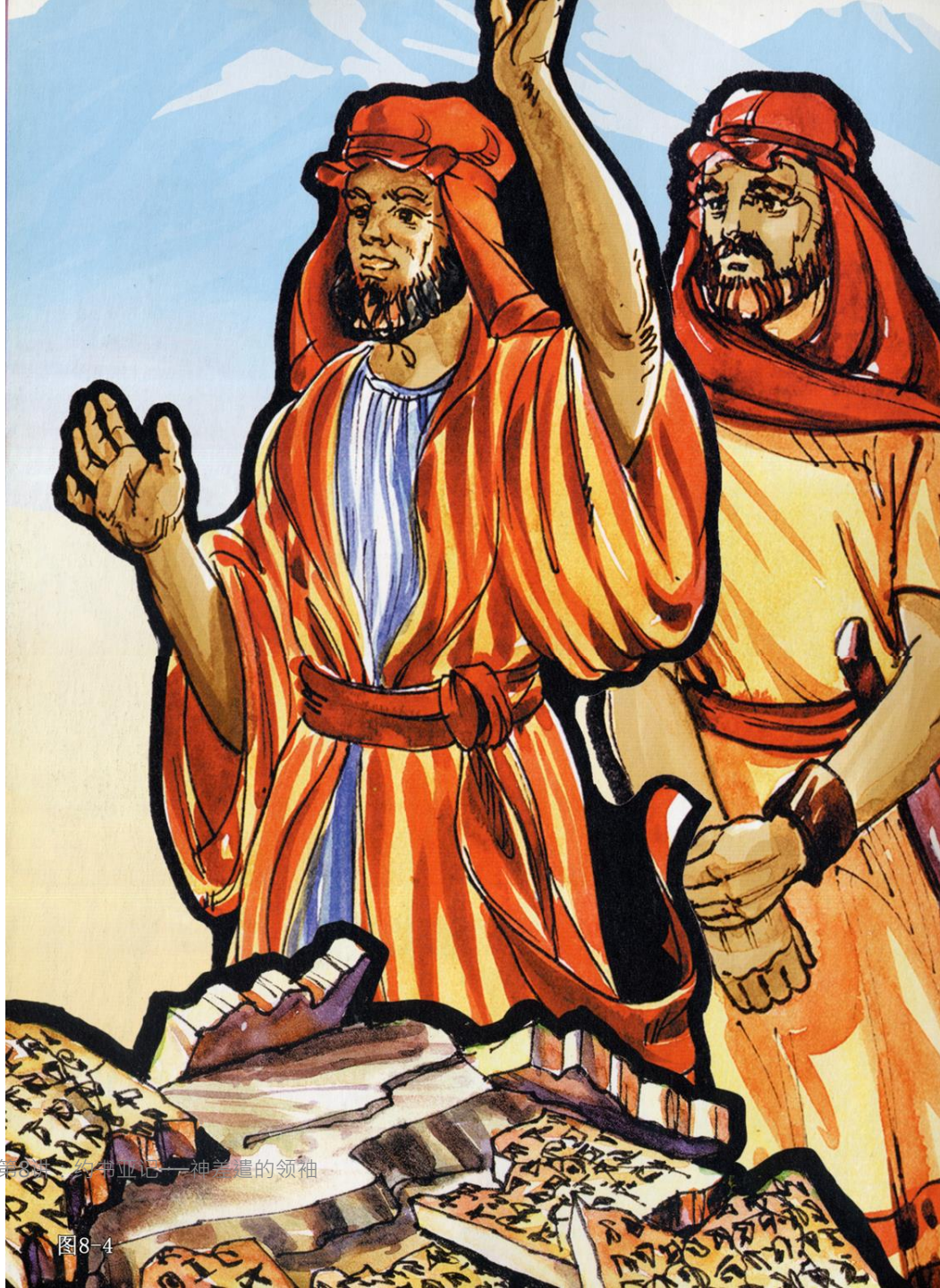
《喜乐树全人成长》第7辑第3卷 希伯来记——神差遣的领袖