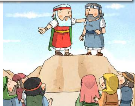
7. 立约书亚为继承人