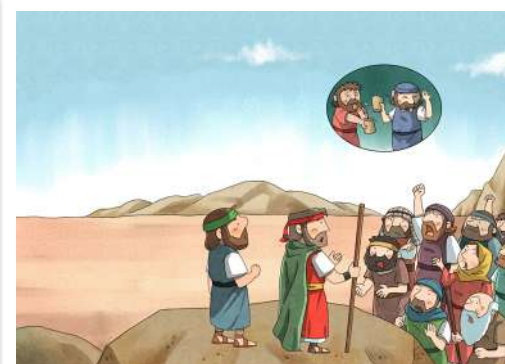
4. 把玛拉的苦水变甜