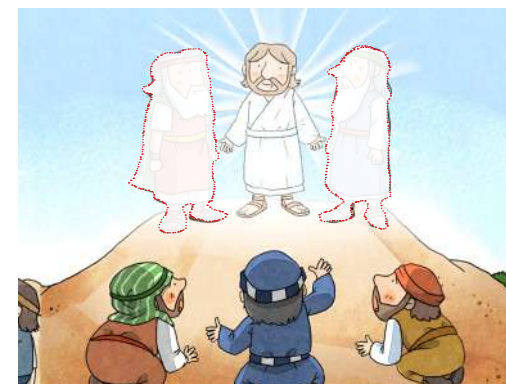
8. 1400年后见到耶稣和以利亚