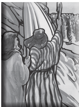
(图 4-4 摩西和亚伦和以色列人)

但摩西十分生气。百姓的埋怨仍在耳边回响。我还要带着这些顽固的人多久？摩西必定想：我厌倦他们不断的抱怨。我已经讨厌他们遇到事情不对劲时，责备我的方式！摩西和亚伦返回营地时，他的愤怒不断升级。