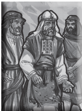
(图 4-4 摩西和亚伦和以色列人)

接着神对摩西和亚伦说话：“因为你们不信我，在百姓面前没有尊我为圣，你们不能领他们进入迦南地。”摩西和亚伦后悔不顺服神。他们不能带领百姓进入应许之地，感到很失望。